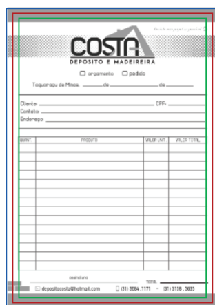
Página 01 (Impressão Frente)

Veja abaixo como montar a sua arte para envio do seu arquivo