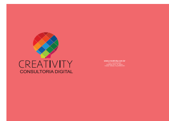
Modelo do produto final

Obs.: É obrigatório sempre expandir sua arte além da margem LINHA DE CORTE, para não ocorrer filete.