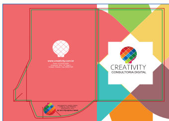
Página 01 (Impressão Frente)

Veja abaixo como montar a sua arte para envio do seu arquivo