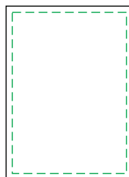
PÁG 3 Miolo Personalizado (1x0 - preto e branco)