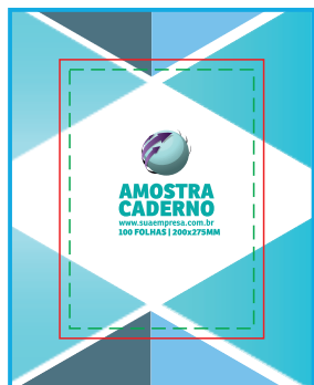
PÁG 1 Capa