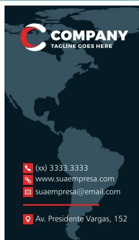
Página 2 - Verso

Caso seu arquivo seja 4x1 favor enviar a segunda página em tons de preto.