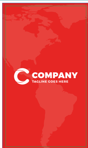
Página 1 - Frente